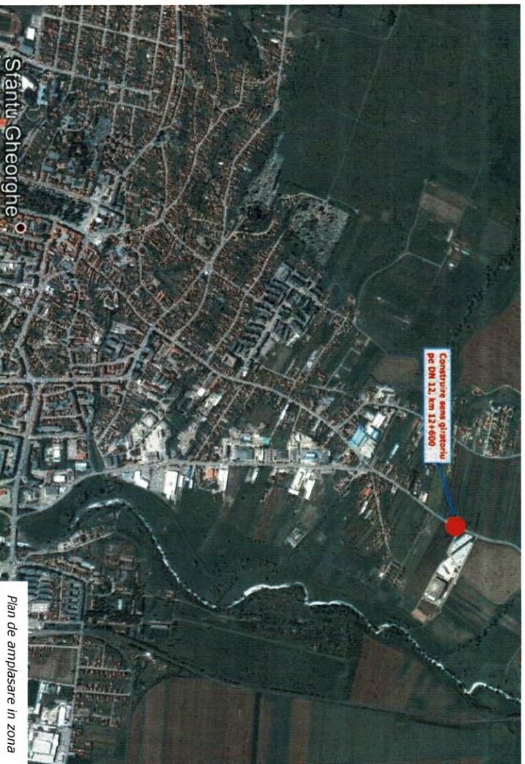
Plan de amplasare in zona

In cadrul acestei investitii se propune construirea unui sens giratoriu pe DN12, km 12+600 din localitatea Sfantu Gheorghe, judetul Covasna.